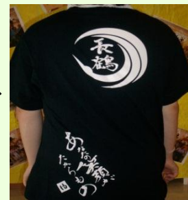
Tシャツのデザインです！