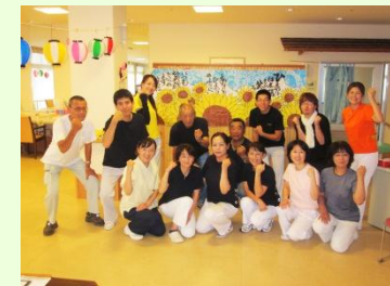
通所リハビリ職員です！