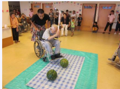
スイカめがけて、カー杯たたくます！