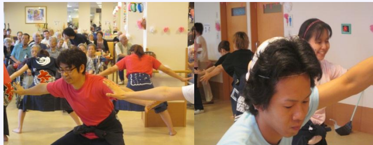
よさこいのスタートです！