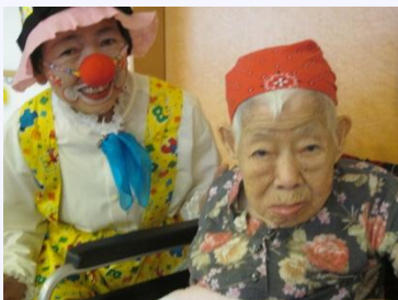
ピエロと記念撮影！