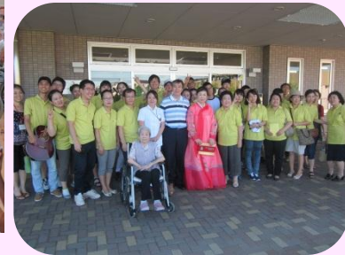
韓国舞踊の披露です！