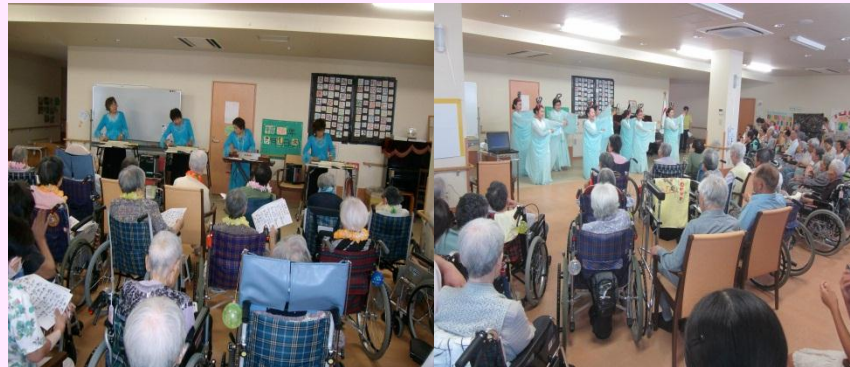
大正琴のきれいな音が響きます